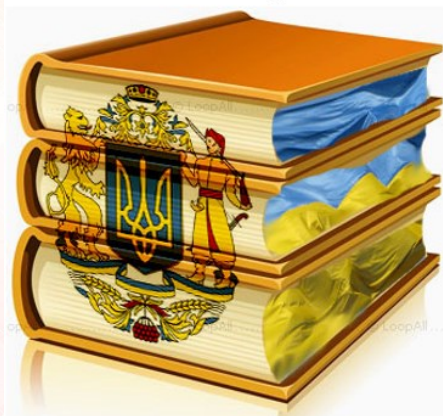
II етап Всеукраїнської учнівської олімпіади з історії 2023-2024 н.р.

Переможцям II етапу бажаємо успіхів у подальших змаганнях!