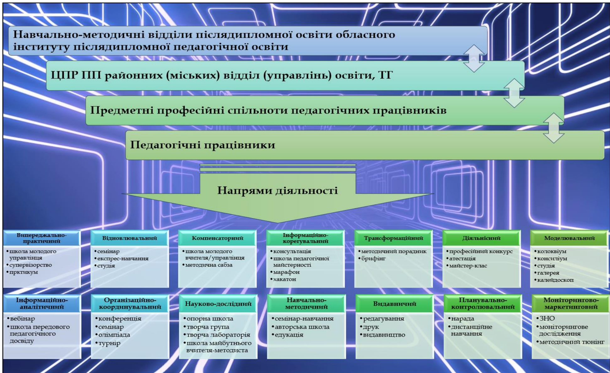
Рисунок 9.1.1. Організаційно-функціональна модель методичного супроводу діяльності педагогів області