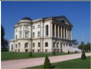
Палац Кирила Розумовського (Батурин)