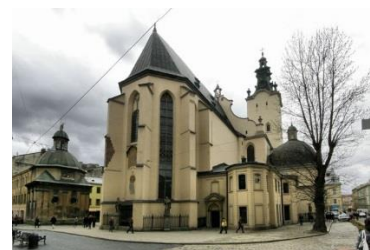
Ансамбль Кафедрального костелу у Львові