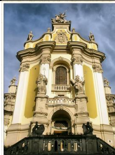
Собор святого Юра у Львові