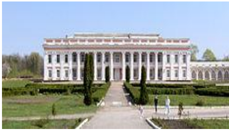
Палац Станіслава Потоцького (Тульчин)

Кожний регіон України має славетну історію, вікові традиції, неповторну культуру. Перед вами визначні пам'ятки архітектури історичних міст України. Укажіть назву та місце знаходження цих пам'яток.