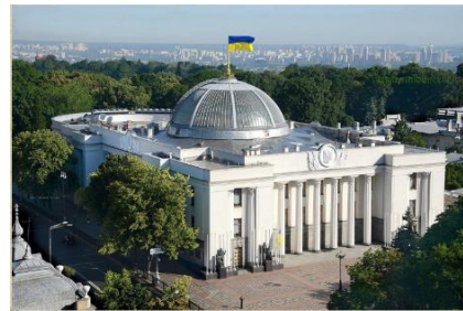
Будівля Верховної Ради (Київ)