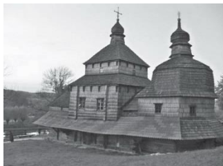
Дерев'яна церква Зішестя Святого Духа в Потеличі