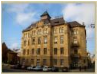
Будинок страхового товариства «Дністер»