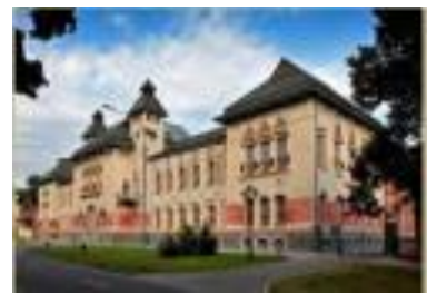
Будинок Полтавського губернського земства