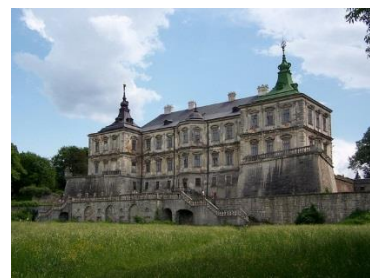
Замок у Підгірцях (Львівська область)