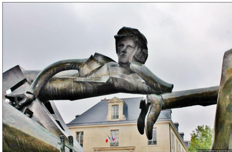
Пам'ятник А. Рембо у Парижі «Подорожній в черевиках, підбитих вітром»

А. Рембо – незвичайний поет. Він вірив в поетичне яснобачення, але в якусь мить зрозумів, що його поезія – це експеримент над собою і веде в нікуди.